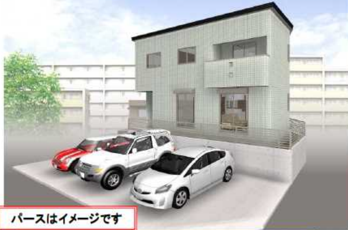
パースはイメージです